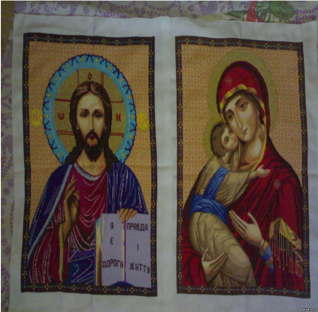
• 刺繍したアイコン